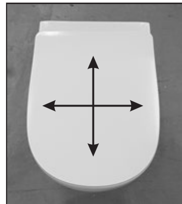
07 Verificare il corretto posizionamento del copriwater prima di serrare definitivamente il fissaggio. Before tightening the fixing screw check the correct position of the seat cover.