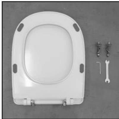
01 Composizione. Composition.