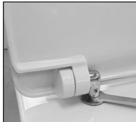
08 Stringere con la chiave in dotazione il fissaggio. Tighten the fixing screw by using the provided key.