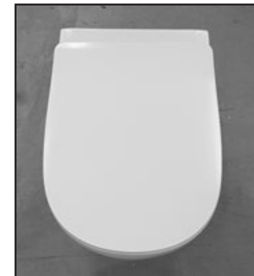
10 Copriwater installato. Installed seat cover.