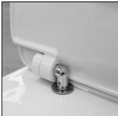
06 Alloggiare il Cw negli appositi fissaggi senza bloccare. Insert the seat cover in the appropriate fixings do not block.