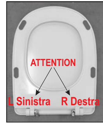
05 Inserire le cerniere negli appositi fori. Insert the hinges in the appropriate openings.