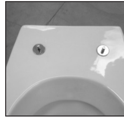
04 Fissaggi inseriti. Inserted fixing screws.