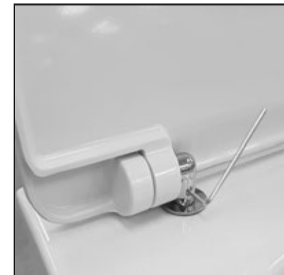
09 Stringere con la chiave in dotazione (brucola) la cerniera sul pin di fissaggio. Tighten the hinge on the screw's pin by using the provided key.