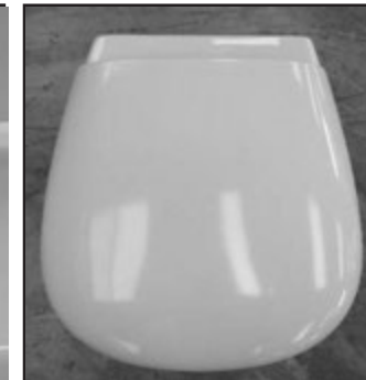
10 Copriwater installato. Installed seat cover.