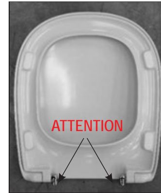
L Sinistra R Destra 05 Inserire le cerniere negli appositi fori. Insert the hinges in the appropriate openings.