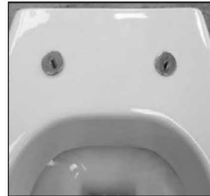
04 Fissaggi inseriti. Inserted fixing screws.