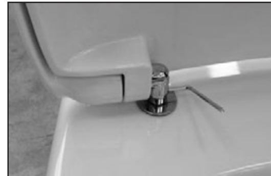
09 Stringere con la chiave in dotazione (brucola) la cerniera sul pin di fissaggio. Tighten the hinge on the screw's pin by using the provided key.