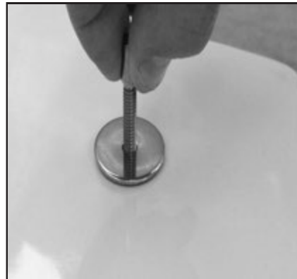
03 Avvitare il fissaggio tenendolo sollevato ma non bloccare. Tighten the fixing screw by keeping it lifted do not block.