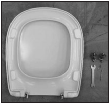
01 Composizione. Composition.