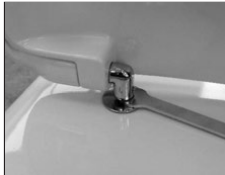
08 Stringere con la chiave in dotazione il fissaggio. Tighten the fixing screw by using the provided key.