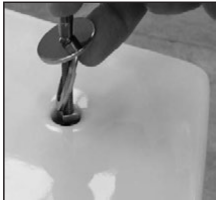
02 Inserire fissaggio nel foro del WC. Fixing screw insertion in the wc's opening.