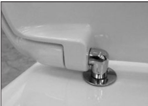
06 Alloggiare il Cw negli appositi fissaggi senza bloccare. Insert the seat cover in the appropriate fixings do not block.